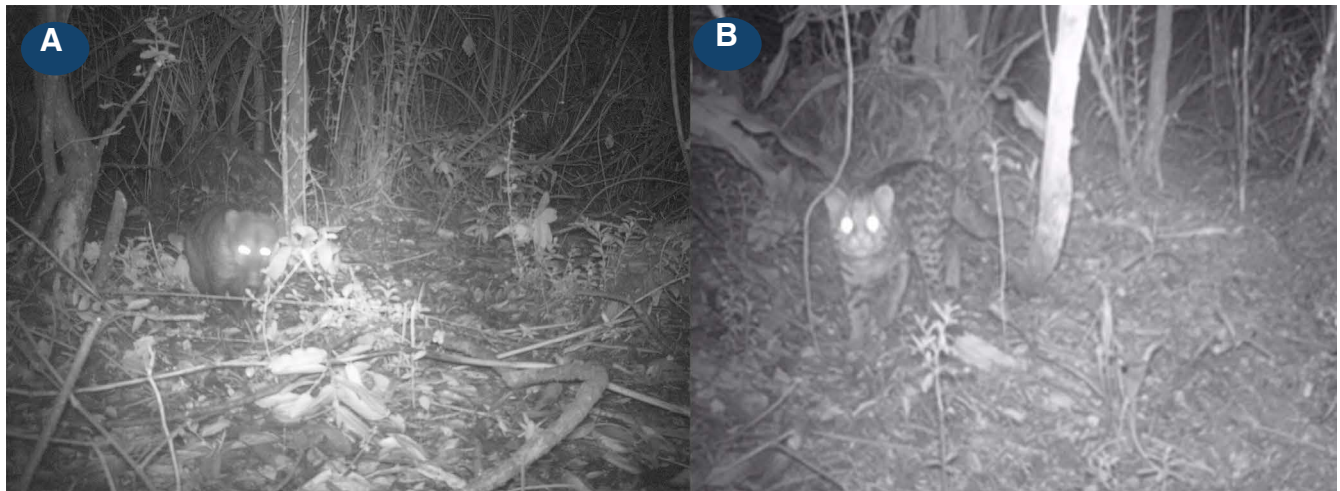
Figura 3. Registro de tigrillo lanudo, Leopardus tigrinus , y Coatí de montaña, Nasuella olivacea , en la Reserva Natural de la Sociedad Civil Jaime Duque, Cundinamarca, Colombia.